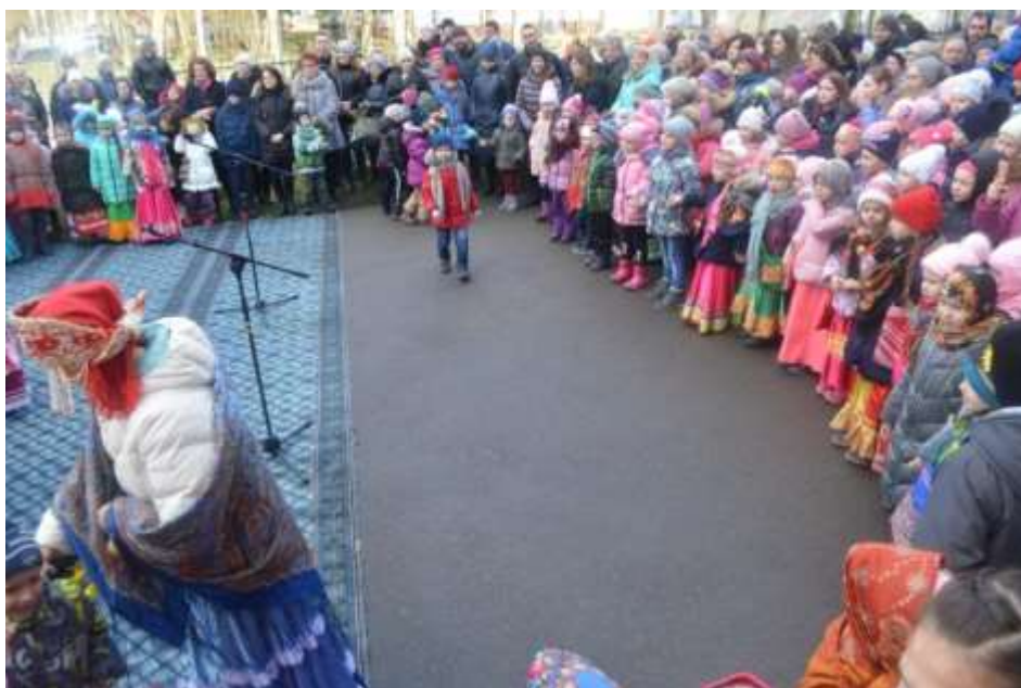
« Выходи честной народ, на игру народную»