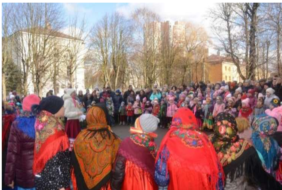
Все вместе играем в игру «Моромушка»