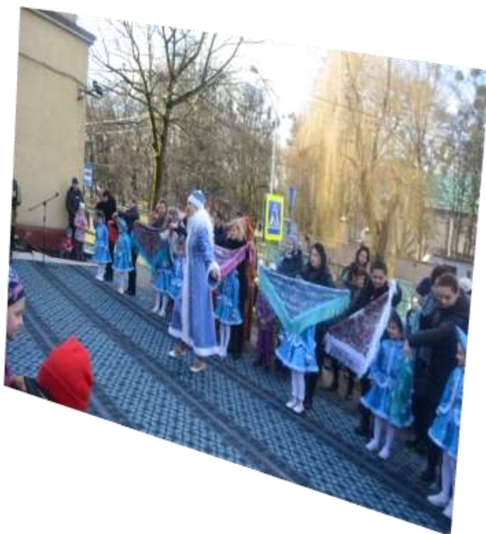
Маленькие помощницы Зимы, привели ее на праздник.